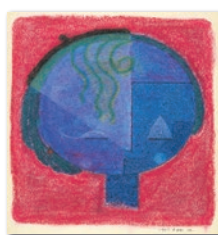
『少女の顔』 1961(昭和36)年8月