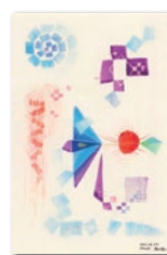
『紙は哀しい』 1961(昭和36)年12月